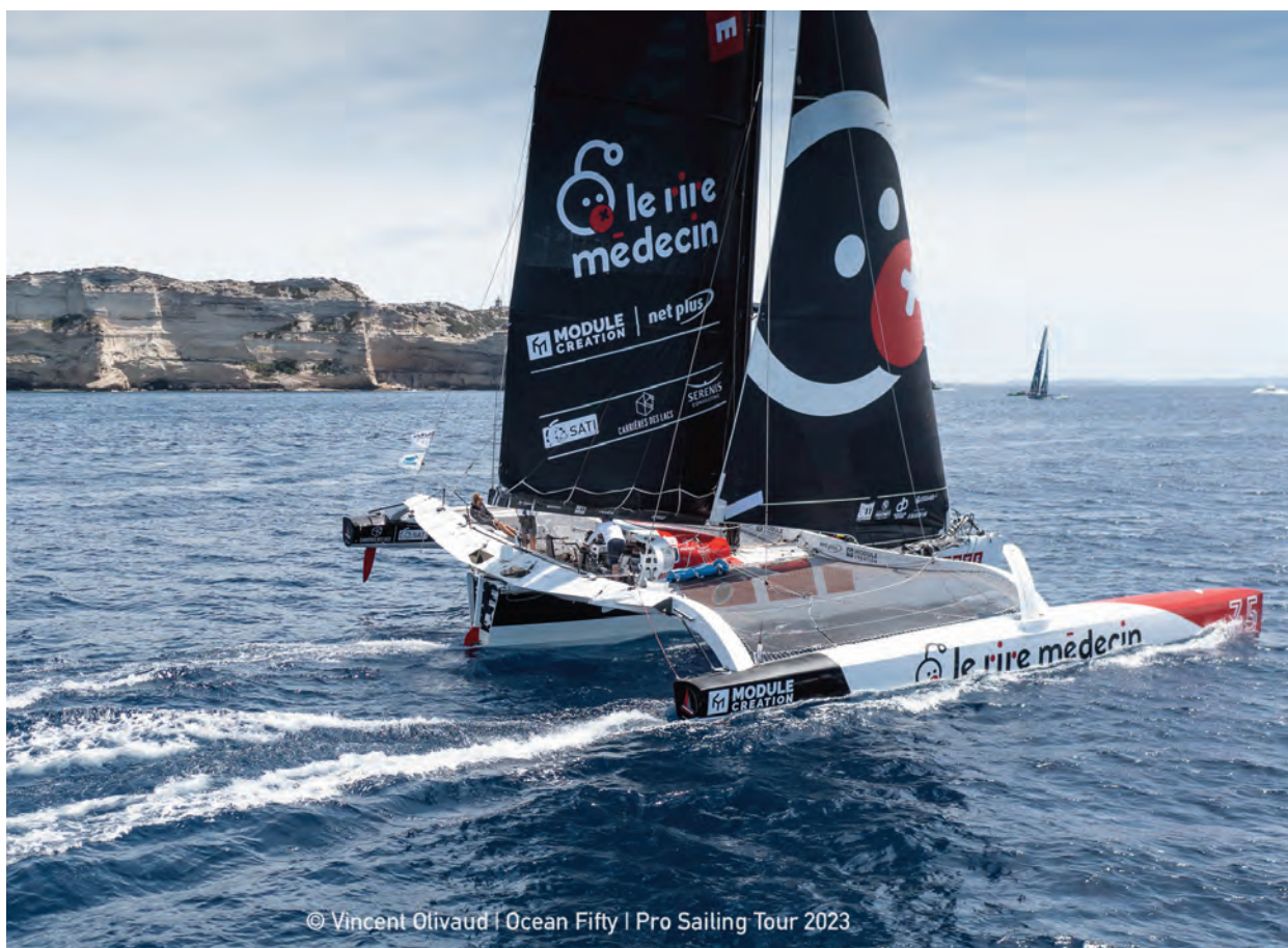
© Vincent Olivaud | Ocean Fifty | Pro Sailing Tour 2023