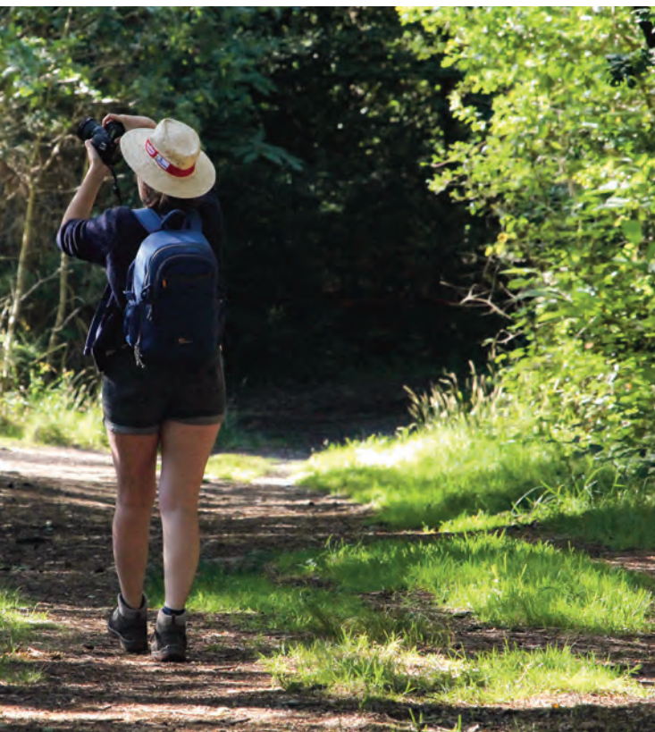
DOMAINE DE CAREIL